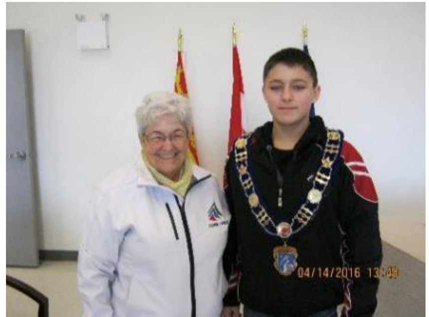
Municipalité de Saint-Antoine