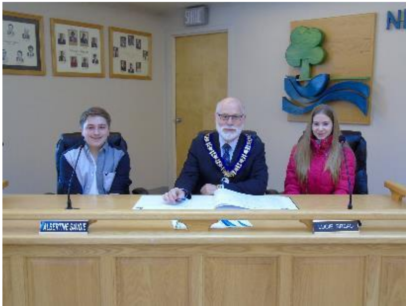
Municipalité de Néguaac